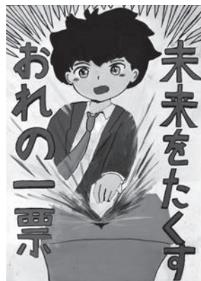
吉村ころろさん作品