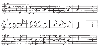
定光寺保育園園歌の楽譜