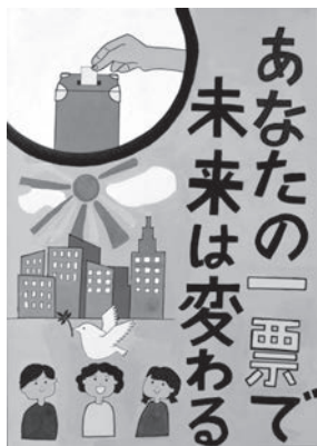
丸山瑛太さん作品