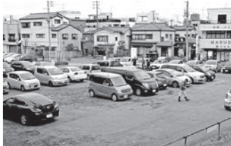
舗装工事を行う第1駐車場