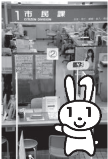
市民課で申請サポート

・写真付きの本人確認書類 の場合：運転免許証、身体障害者手帳、パスポートなどの公的な証明書を1点