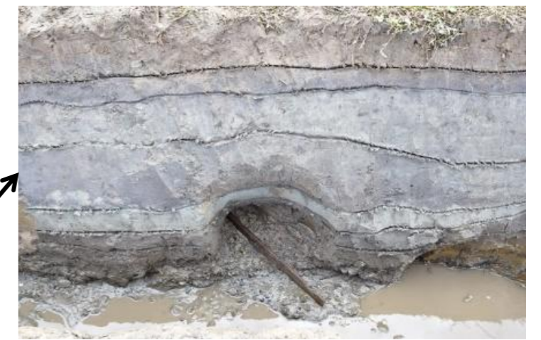
剣形木製品出土状況(北西から)