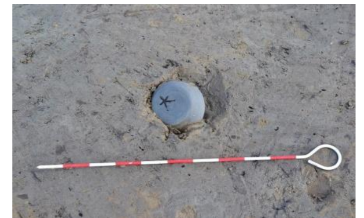
墨書土器出土状況