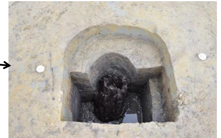
柱根出土状況(南から)