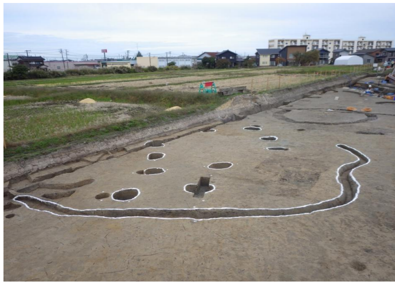
掘立柱建物(南から) 2間×3間 平面積約18㎡