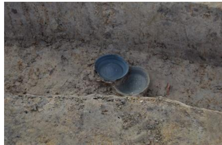
溝 遺物出土状況 完形の須恵器などが出土している、