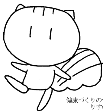
健康づくりのマスコット りすのこーちゃん

加茂市では、市民有志が中心となった「かも健康長寿県内No.1プロジェクト」と連携して健康増進事業に取り組んでいます。 その一環として、今年度から「かも健康ポイント事業」を実施します。 テーマはコチラ