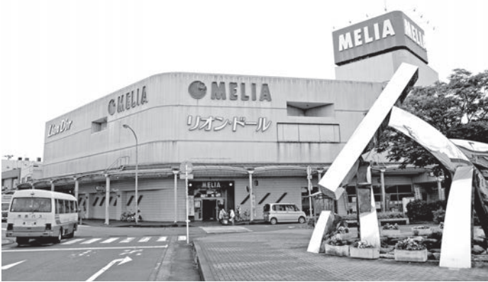
メリア外観（7月3日撮影）

の答弁で述べていますので、その一部をこちらに掲載いたします（全文は、加茂市議会ホームページの録画映像または9月上旬掲載予定の会議録をご覧ください）。各スーパーの敬称は省略しています。