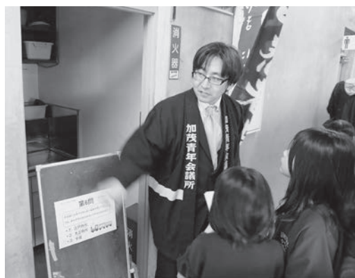
トレジャーハンティングでは担当委員長として携わりつつ...

は、学生が来ている事をよく知っているけれど、地元の人たちがあまり知らないと思うので、商店街にとどまらずもっと活動を拡げていきたいです。」と、市内の色々な所で学生と地域の人たちが連携するイベントを企画したいとのことでした。