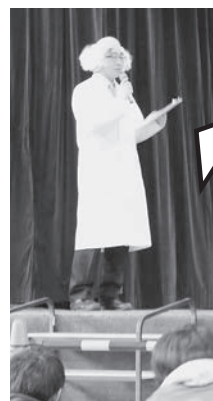
博士役として舞台にも

加茂の街の魅力については「就職が理由で住んだので、来てすぐには気づかなかった」と前置きしつつ「けれど、住み始めてじわじわと加茂の街の良い所を 発見 するようになりました。具体的には、喫茶店が多いですよ。長年続いているお店とか、レトロな雰囲気