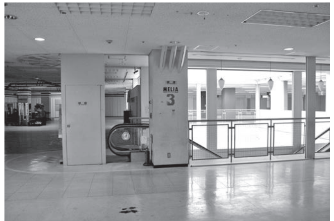
メリア3階（7月3日撮影）

加茂市議会に対しては、この答弁の中にもあるとおり全員協議会の場合や書面で質問を受け、何回かご説明申し上げてきました。その中で主な議論となったのは、3階