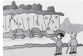
③がけに割れ目が見える