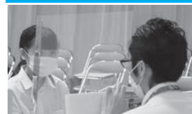
仕切り板越しに会話する 企業担当者と生徒

今年で9回目となる加茂地区新規高卒求人説明会が、7月16日に産業センターで開催されました。参加企業は県央地区を中心に51社、参加高校は市内3校のほか、他市からも16校が参加し、参加生徒数は186名となりました。今回は新型コロナウイルス感染症対策として、