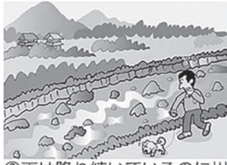
②雨は降り続けているのに川の水位が下がる