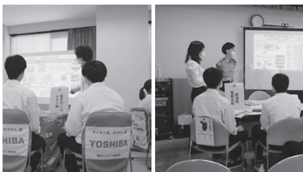
2階・3階会場の企業ブース