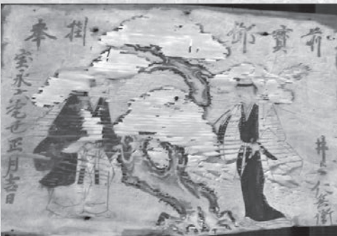
宝永6年(1709)奉納の絵馬(高砂翁媪図)