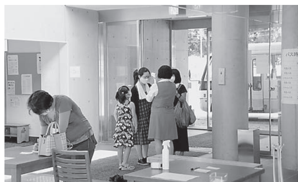
入り口では検温と住所氏名・連絡先の記入をお願いします