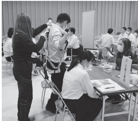
作業用器具を付けてもらう生徒