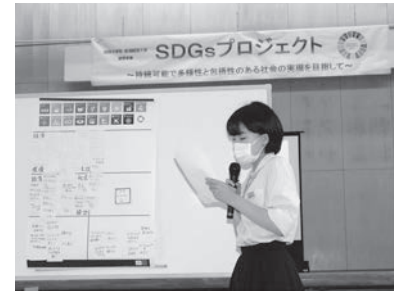
グループでの結論を発表する生徒