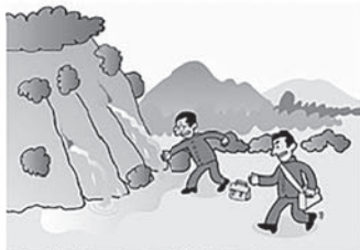
②がけから水が湧き出ている