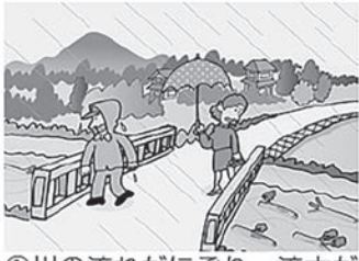
①川の流れがにごり、流木が混ざりはじめる