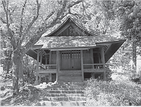
貴船神社の拝殿(拝殿は扉で閉められ、 絵馬は右手に掲額)