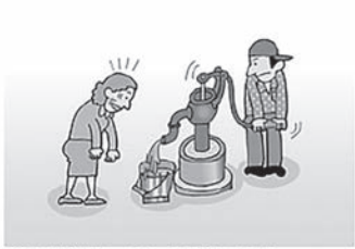
①沢や井戸の水がにごる