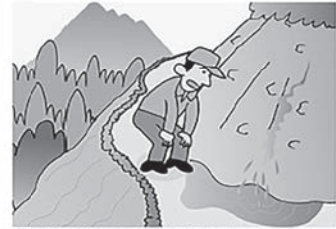
③斜面から水が噴き出す