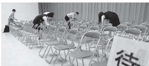
座席の消毒の様子