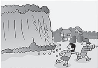
①がけから小石がパラパラと落ちてくる