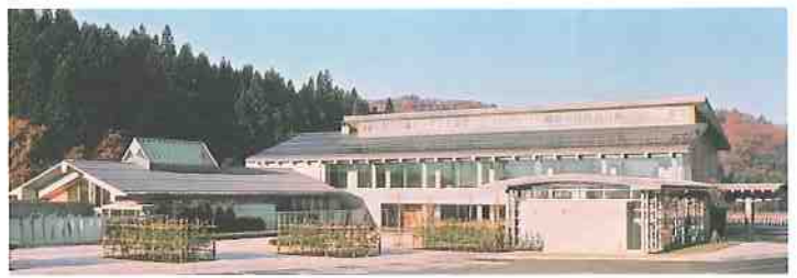
日本のトップクラスの泉質と豊富な湯量の加茂美人の湯