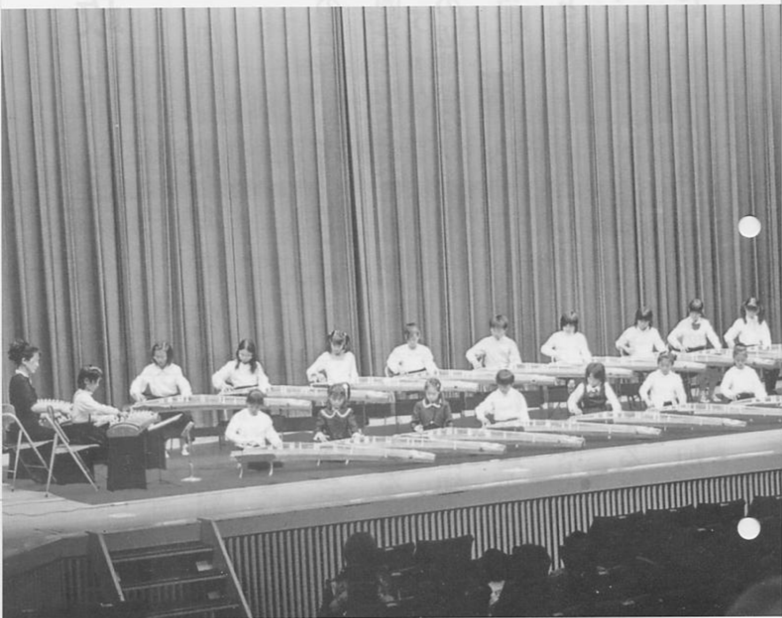
加茂市箏曲こども教室の演奏（市民芸能祭10月23日）