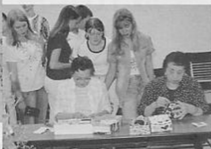
手まりの制作を見学