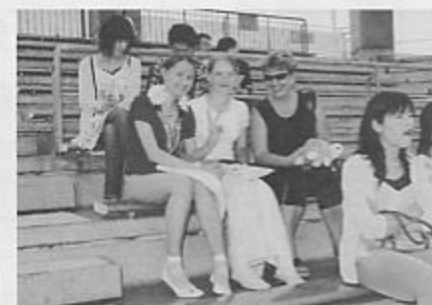
マリンピア日本海で