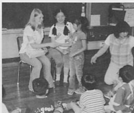
加茂西小学校児童と交流

葵中学校の四校で、遊びや料理・カタコトの英語での会話から、お互いの国の習慣や生活について知ることができたようです。加茂中学校・葵中学校では、同じ年齢同士ということもあり、お互いの趣味や得意科目、食べ物について話題になっていました。