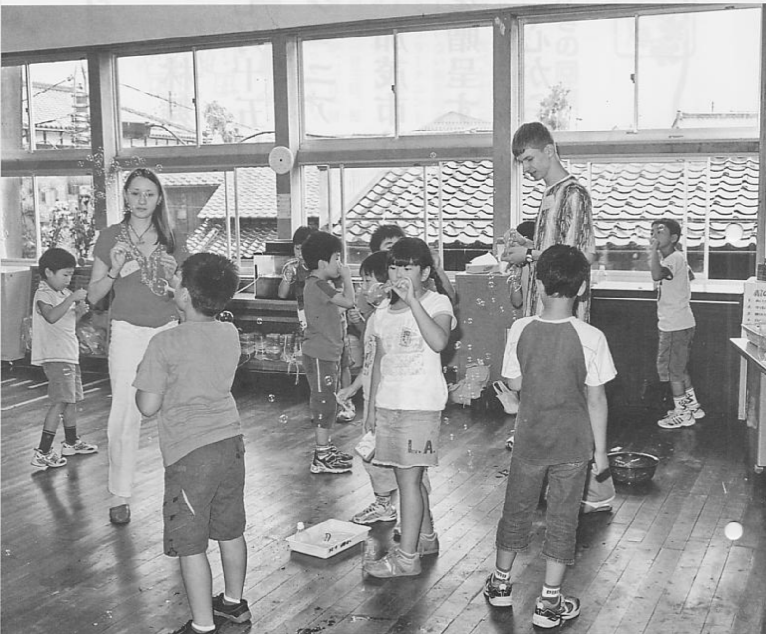
加茂西小学校を訪問したコムソモリスク市子ども代表団(7月14日)