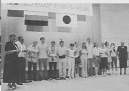
産業センターでの歓迎パーティー