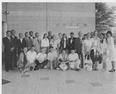
市役所正面玄関で記念撮影