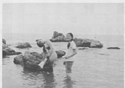
初めての「海」を体験

イ先のホストファミリーの皆さんと代表団の子どもたちとの交流が始まっています。毎回、代表団の子どもたちには、二泊三日のホームステイを滞在プログラムに組み入れています。十二のホストファミリーの皆さんは、日常の生活をそのままに過ごしていただいたようですが、帰国のときには涙を目に浮かべてのお別れが加茂駅前の広場で見られました。 加茂市とコムソモリスク・ナ・アムレ市との子ども代表団の交流は、平成四年から一年ごとに訪問と受け入れを交互に実施し、今年で十四年目となりました。国際化が進んでいる現在、いろいろな国の人たちと交流していくこととなる子どもたちには、楽しい経験となったことでしょう。