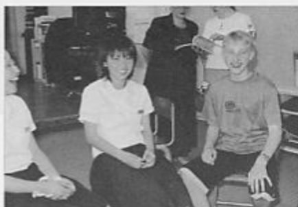
葵中学校での交流