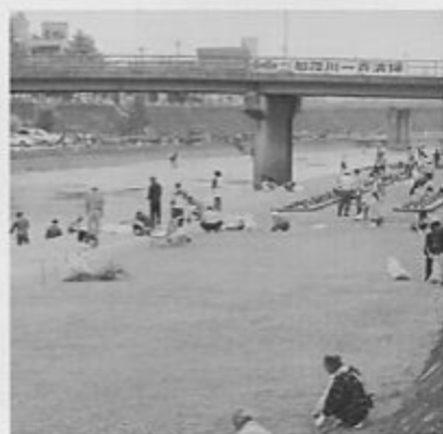
加茂川一斉清掃 毎年恒例となり、家族で参加される方が多くなりました。まだまだ、たばこの吸いがらやごみが多く捨てられています。このごみを少しずつでも減らしていきたいですね。