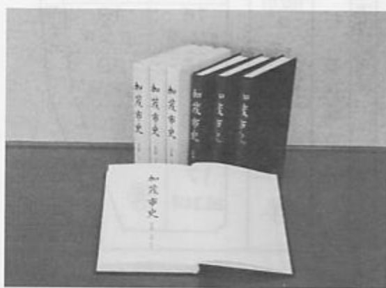
新しい「加茂市史」 資料編1 古代・中世

新しい加茂市史は、次の場所で販売しております。また、電話でお申し込みになることもできます。