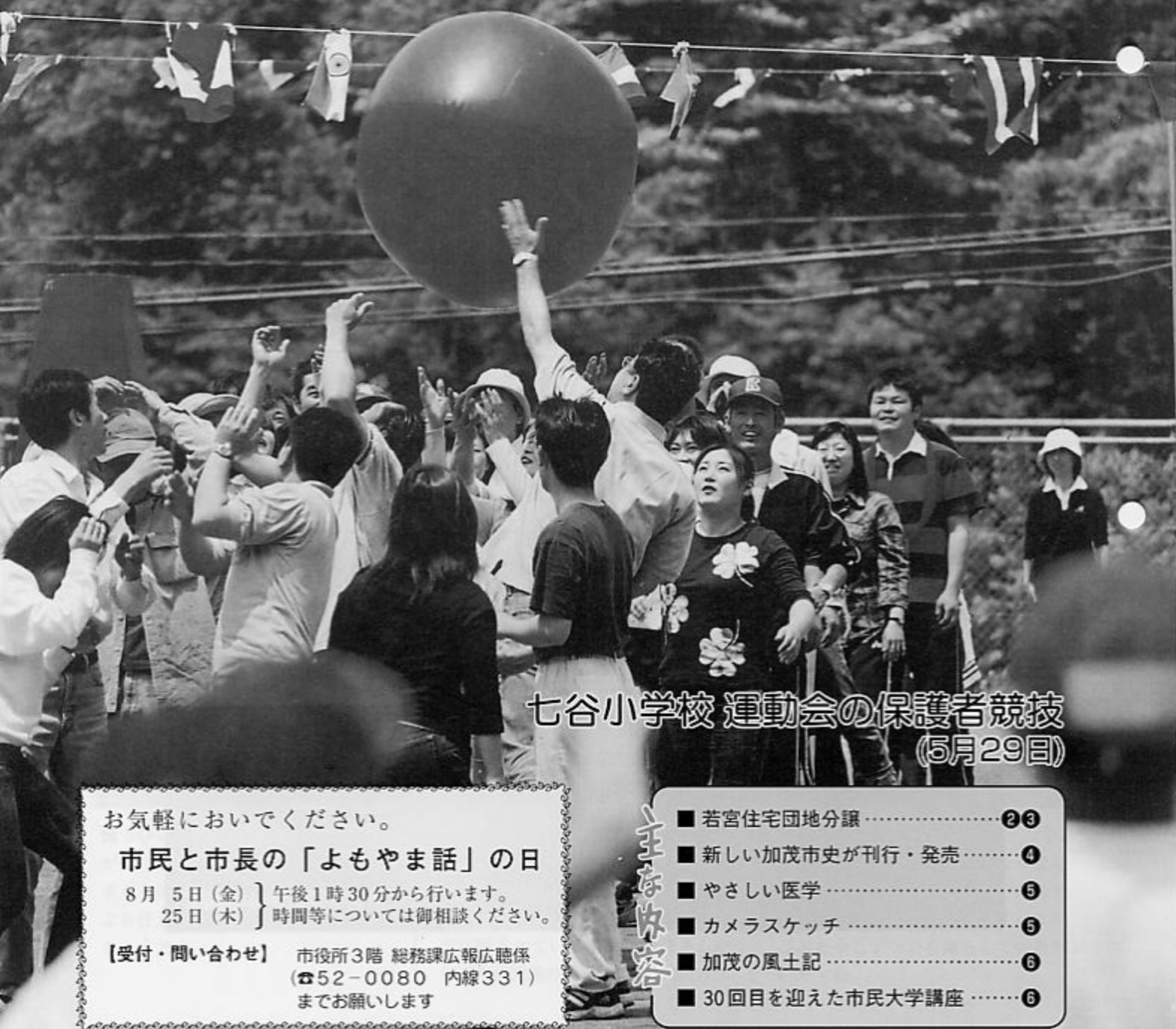
七谷小学校 運動会の保護者競技 (5月29日)