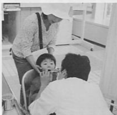
歯びいスマイル 子どものむし歯が気になって、というお父さんお母さんも診てもらっていました。子供より注意を受ける方もいらっしゃったようです。