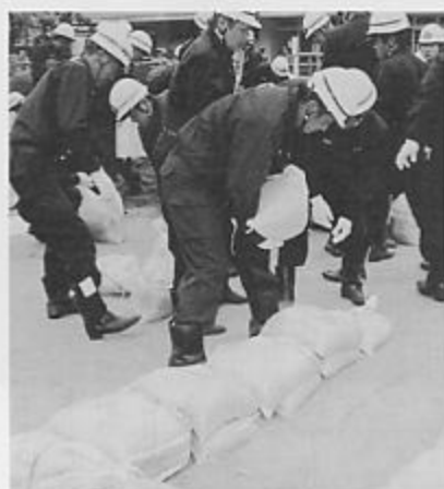
春季消防演習 昨年7月の大雨や10月の地震などの自然災害や火災現場で活躍されている消防団の皆さんが日ごろの訓練の成果を披露しました。