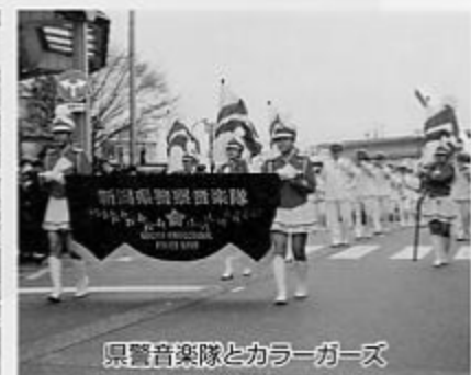
県警音楽隊とカラーガーズ