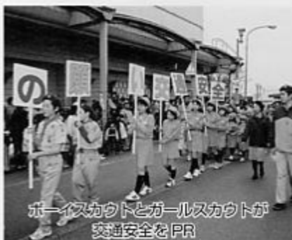
ボーイスカウトとガールスカウトが 交通安全をPR