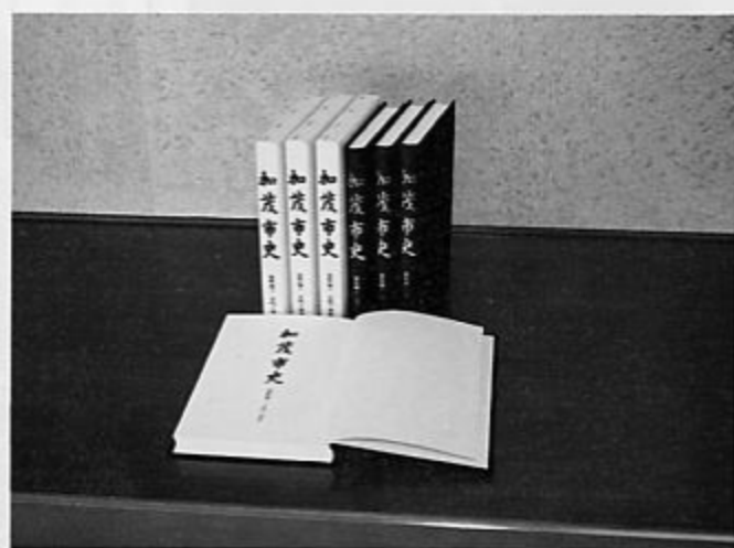
新しい「加茂市史」資料編1 古代・中世

このたび刊行される加茂市史は、歴史的な資料によって裏づけられ、資料編を備えた、学問的批判に耐えうる、小京都加茂市の本格的な市史であります。