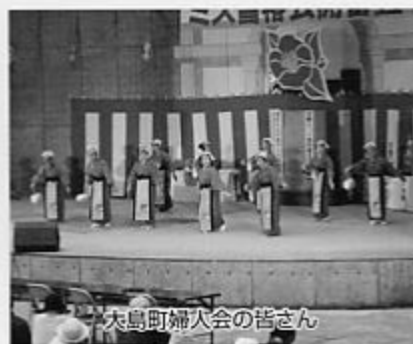
大島町婦人会の皆さん