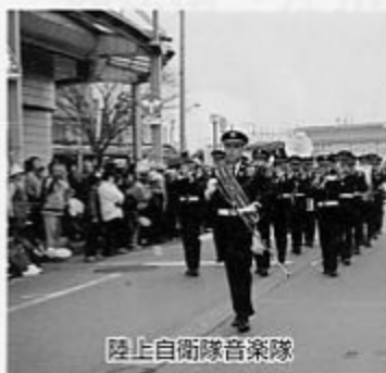
陸上自衛隊音楽隊

ズを先頭に交通安全母の会と保育園児、人気の一栄楽団、大島町の皆さん、陸上自衛隊音楽隊、幼年・少年消防クラブの子どもたちが参加しました。 〔雪椿マラソン〕 バレードの始まる前の午後二時三十分には、JR加茂駅前から雪椿マラソンがスタートしました。百八十二名の参加があり、陸上競技場のゴールをめざして走る姿に、コース沿道から声援が送られました。 〔24日、雪椿杯バレエボール大会〕 県内各地で活躍している「ママさんバレエボール」のチームでは、この大会を楽しみにしているそうです。なかなか対戦することのできない強豪チームが参加することで知られており、自分たちの練習の成果をはかる大会として中・下越を中心に十六チームが出場しました。