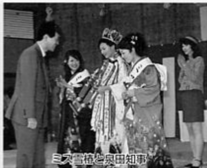
ミス雪椿と泉田知事