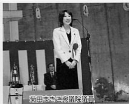
菊田志きこ衆議院議員