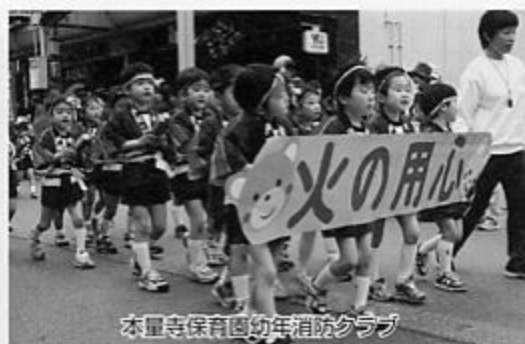
本量寺保育園幼年消防クラブ