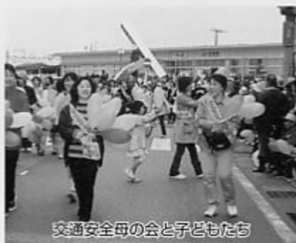
交通安全母の会と子どもたち