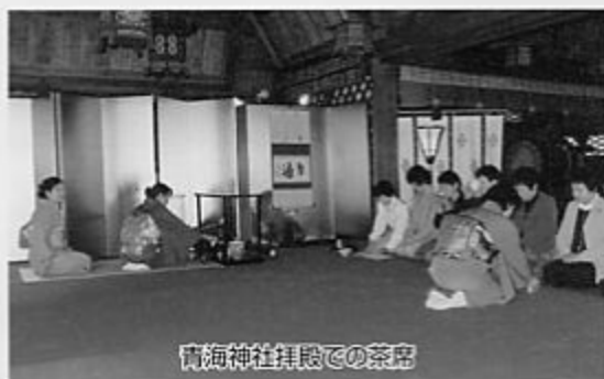
青海神社拜殿での茶席