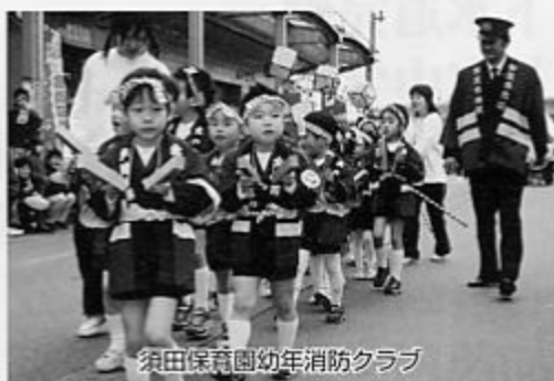
須田保育園幼年消防クラブ