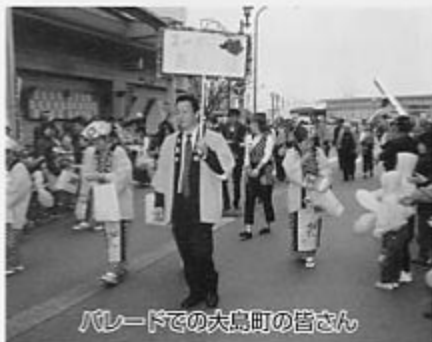
バレードでの大島町の皆さん