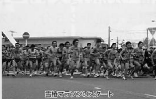
雪栴マラソンのスタート