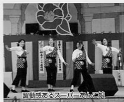
躍動感あるスーパーあんど娘