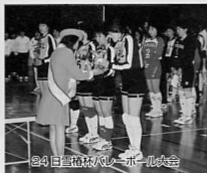
24日雪栴杯バレーボール大会