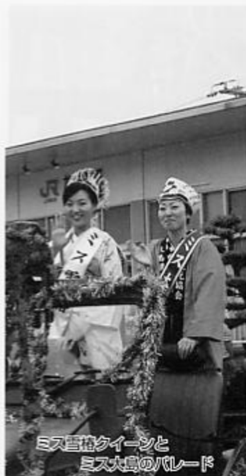
ミス雪椿クイーンと ミス大島のバレード