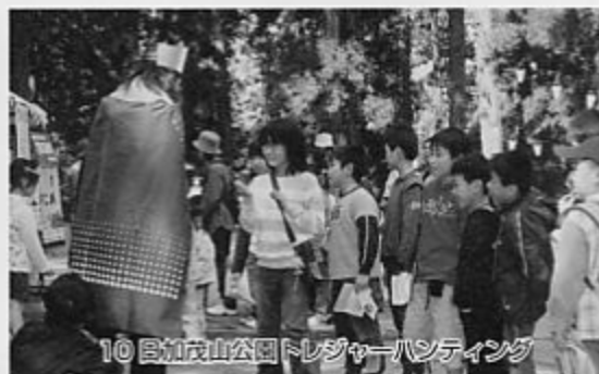
10日加茂山公園トレジャーハンティング