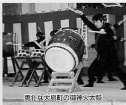
勇壮な大島町の御神火太鼓