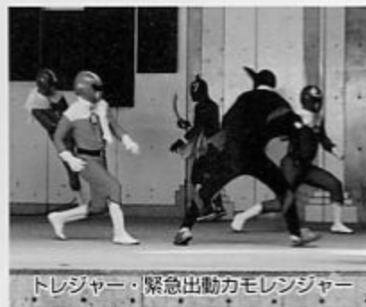
トレジャー・緊急出動カモレンジャー