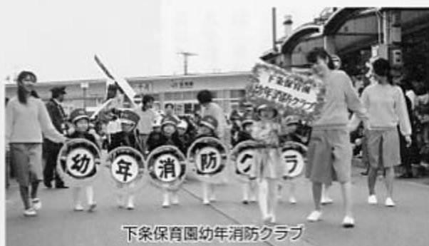
下条保育園幼年消防クラブ