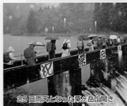
29日雨天となった粟ヶ岳山開き