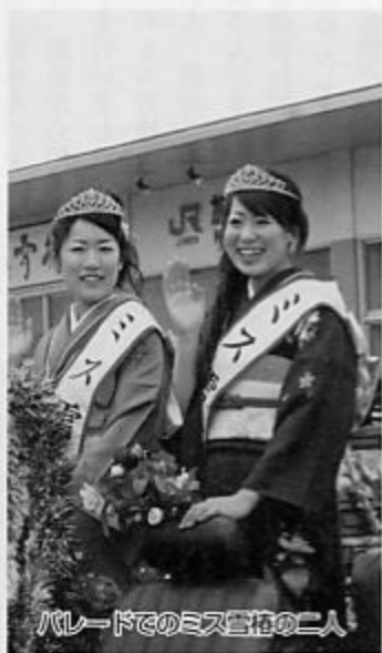
バレードでのミス雪椿の二人

〔29日、市民茶会〕 早朝の雨の予報により、市民茶会の加茂山杉木立と池の端での野点は会場が公民館となりました。各茶席は、たくさんのお客さままでにぎわい、一服のお茶でひとときを楽しんでいました。 〔粟ヶ岳山開き〕 また、午前七時三十分には、水源池第二ダムで粟ヶ岳の山開きが行われました。年明けからの大雪で登山道のいたるところに例年より雪が残っていたそうです。