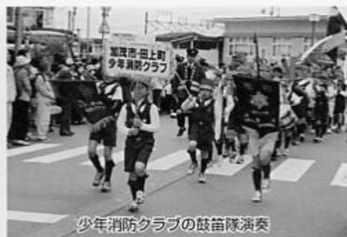
少年消防クラブの鼓笛隊演奏