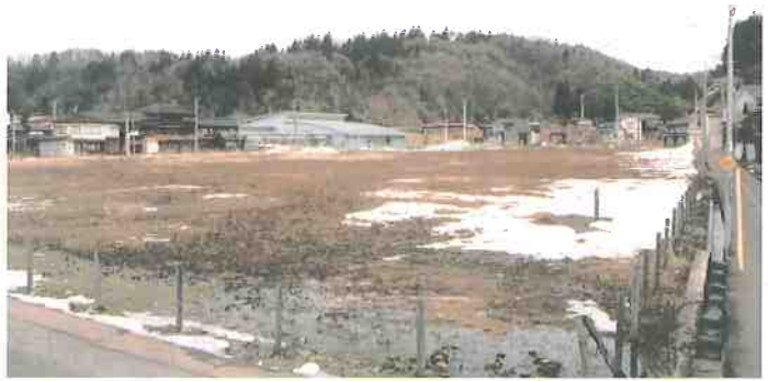
特別養護老人ホーム「第三平成園」建設予定地(神明町一)