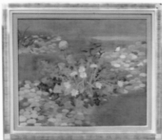
日本画 「タンポポ」 金子 さだ子