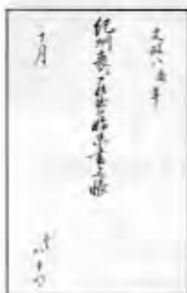
「紀州表江籠出船始末書上帳」の表紙と後須田諏訪神社の祈願札

感後須田の村名主が大納言様に拝認し、供応を受けることとなり、未曾有の出来事であったろう。特異な名主八十八の証の墓碑すら無いのが残念だ。ただ、後須田諏訪神社に祀られている掲出の祈願札にその存在を憶ふだけである。