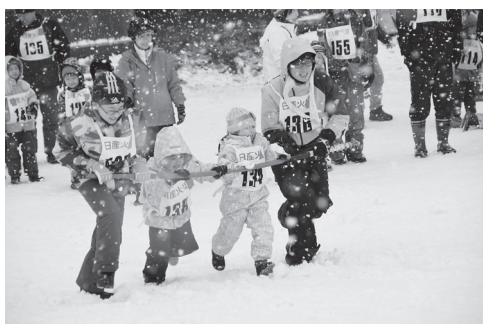
市民雪上レクリエーション大会（2月17日） 小雪の影響で2月の開催となりました。