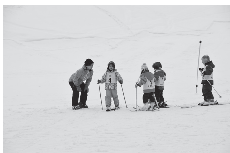
ホリデースキー教室 市内外から参加があり、 初めての人も楽しく滑れるようになりました。