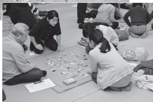
ふるさと加茂かるた大会（2月2日）

競技は普通サイズのかるたですが、ジャンボかるたは座布団ほどの大きさで、足元にあってもなかなか見つけられないようでした。