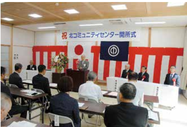
大広間で行われた開所式の式典のようす