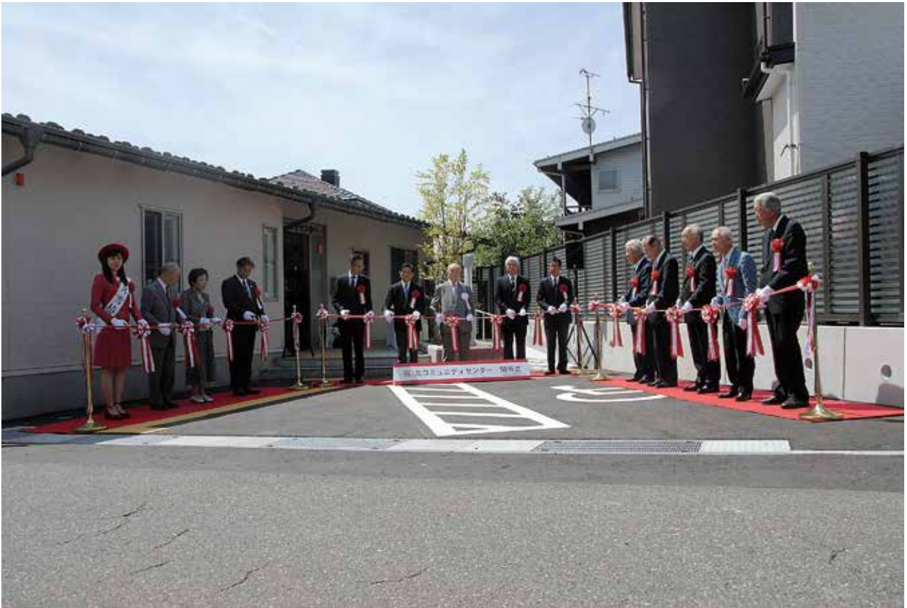
玄関前でのテープカットのようす