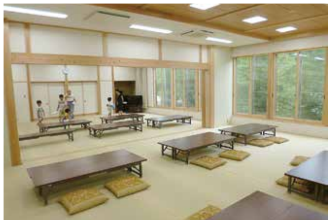
大広間は40畳の二間に区切って利用できます