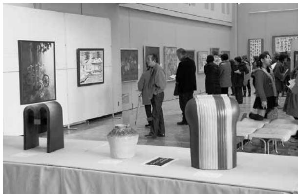
同時に開催されていた新春美術展