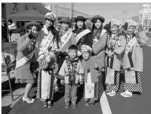
ミス大島、ミス熱海、東海汽船マスコットガールとミス雪椿の記念写真