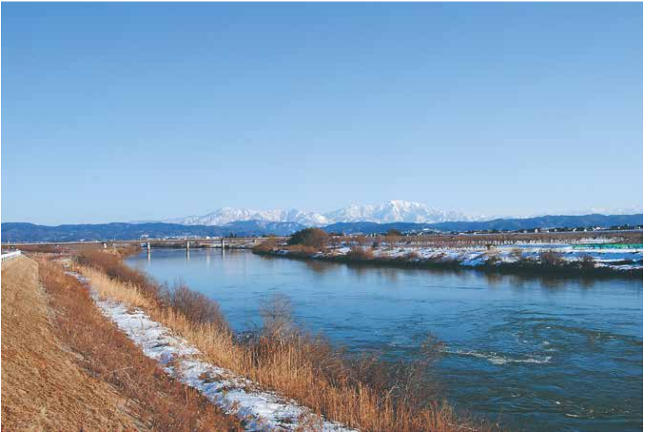
加茂大橋と栗ヶ岳