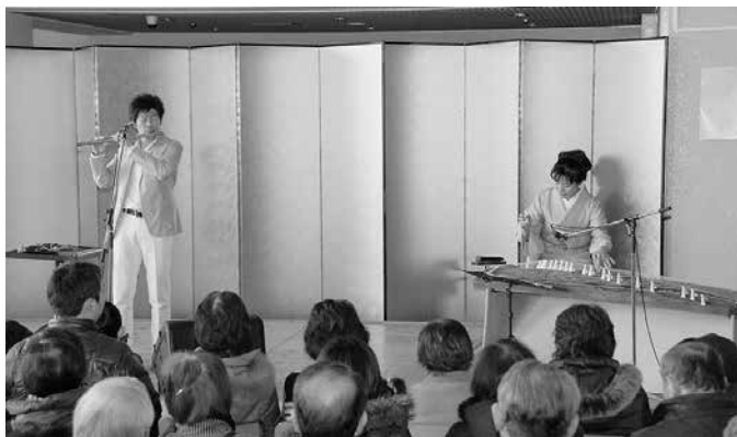
200人を超える方が演奏を楽しみました