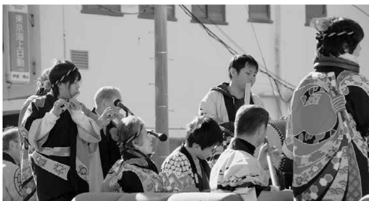
ザ・松坂／花友会の中・高校生メンバーもパレードに参加