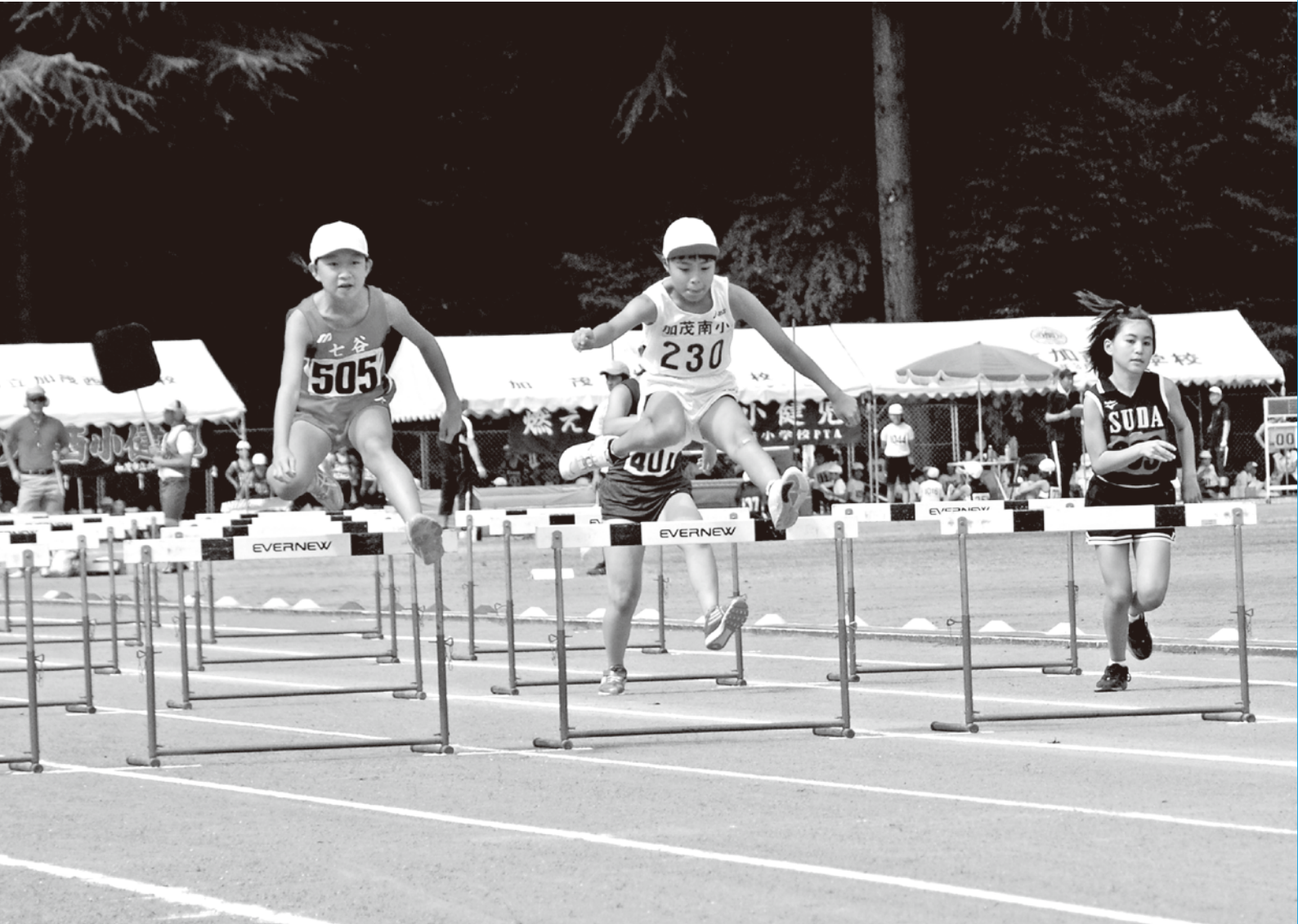
80mハードルで最後の8台目のハードルを越える選手 加茂市小学校親善体育大会陸上記録会（9月25日）