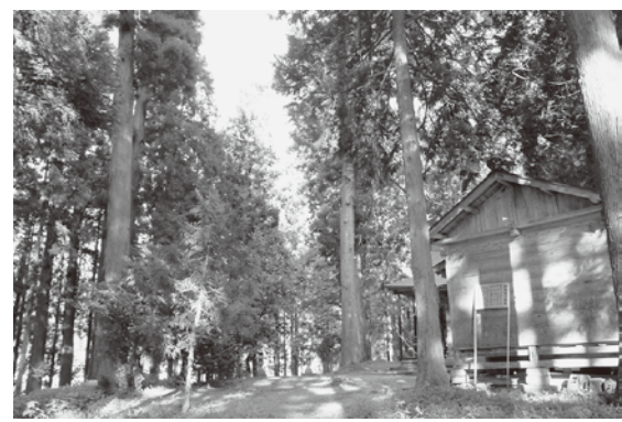
日吉神社境内にある杉の大木

られていると記されている。この最も太い杉が名木に指定された杉であるとすれば、二百八十年間に幹周囲が約二m太くなったことに興味がある。