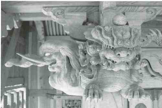
正面向かって左側吽形獅子と脇に配置される象鼻