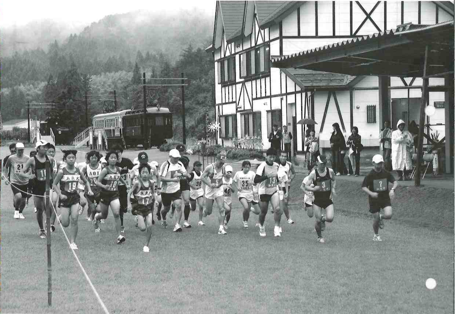
第10回市長杯 冬鳥越クロスカントリー大会スタートの瞬間 (9月23日)