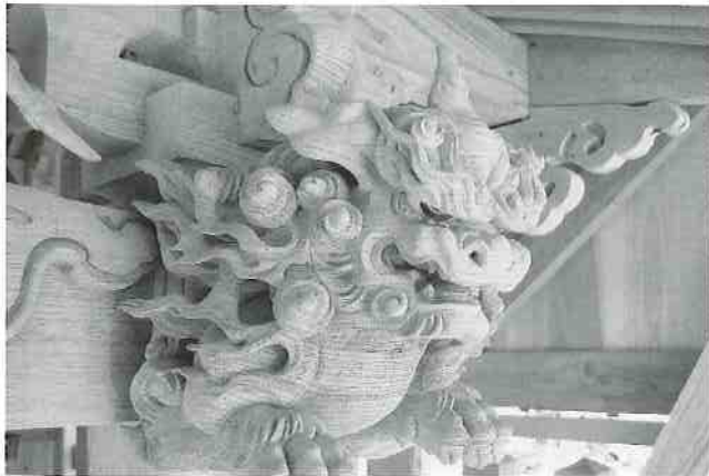
正面向かって右側の角を生やした阿形獅子