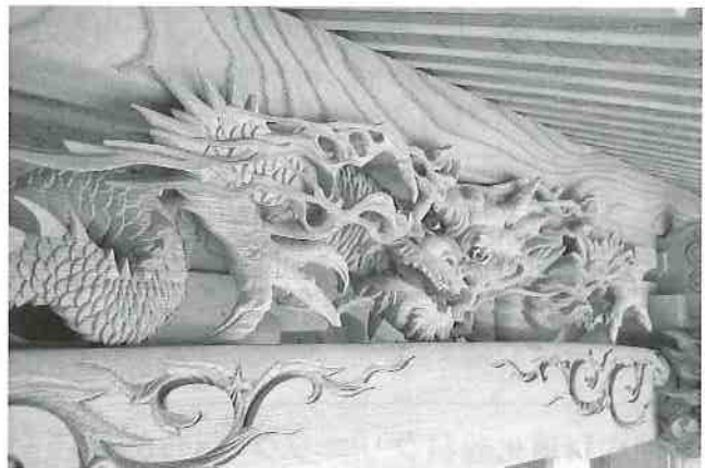
ガラスの眼光が鋭い正面水引虹梁上の龍