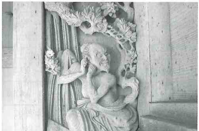
本殿左の廻縁にある中国故事にちなんだ脇障子