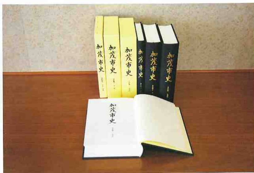
新しい「加茂市史」資料編1 古代・中世 資料編2 近世 資料編3 近現代

このたびの巻は、「資料編2近世」が 合計ページ数九百八十三ページで一冊 三千五百円、「資料編3近現代」が合計 ページ数千一ページで一冊三千五百円