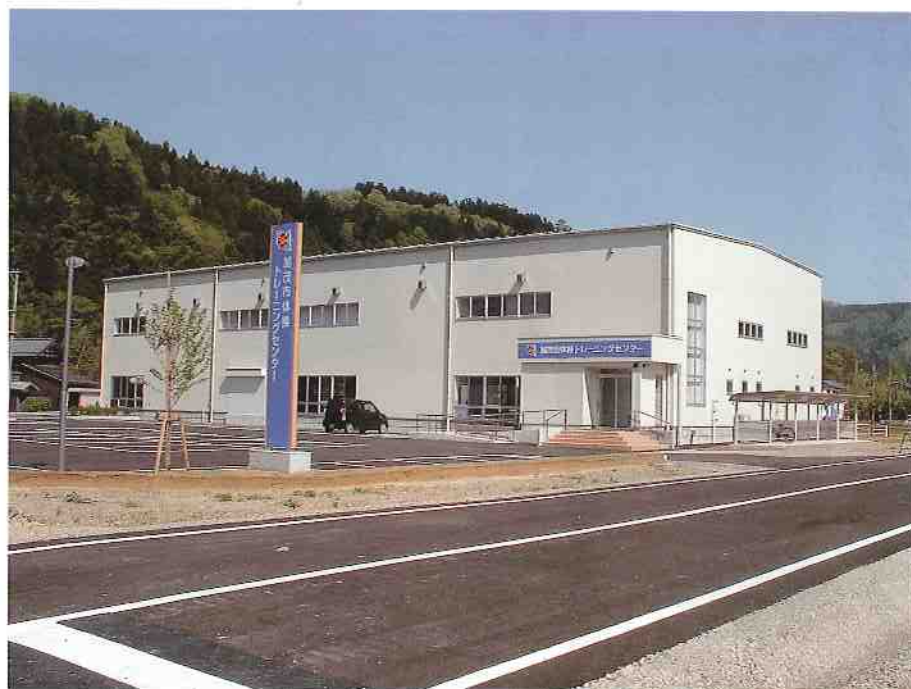
加茂市体操トレーニングセンター

ドイツ女子体操チームが、加茂市の この優れた施設で直前の練習を十分に 行われ、北京オリンピックで好成績を 挙げられることを、加茂市民の皆様と 御一緒に御祈念いたしたいと存じます。