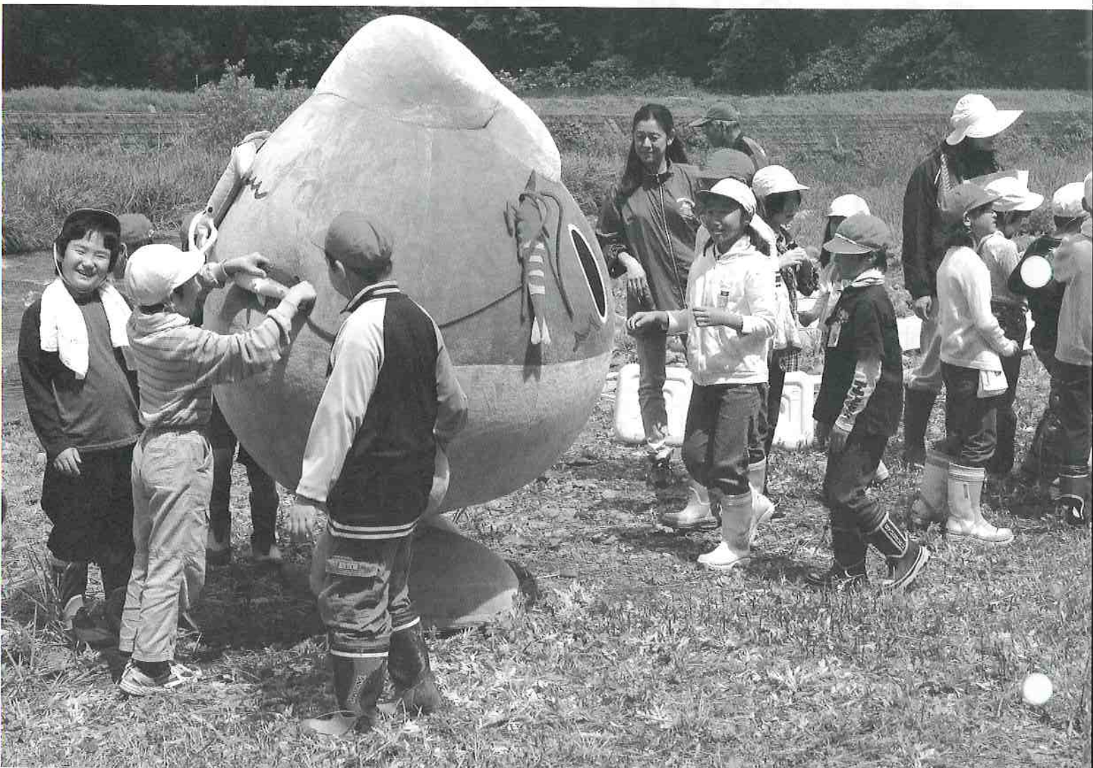
七谷小・七谷保育園・高柳保育園の子どもたちとまもりんがアユの稚魚を放流 (9月に行われる全国豊かな海づくり大会のプレイベント・5月26日)