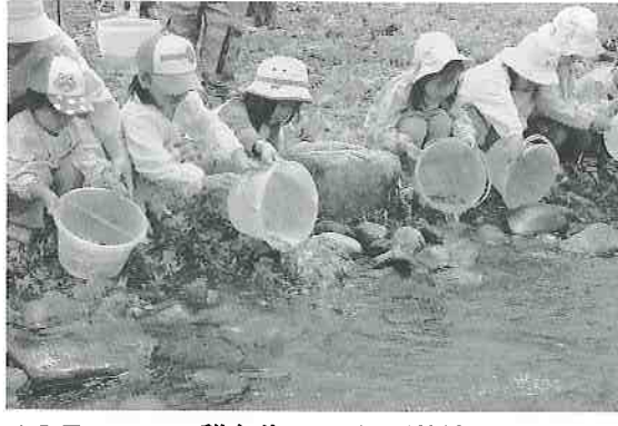
この日、アユの稚魚約5,000尾が放流されました。