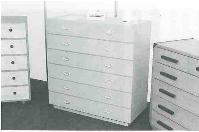
(財)伝統的工芸品産業振興協会会長賞 「La KIRI 1000」(有)茂野タンス店