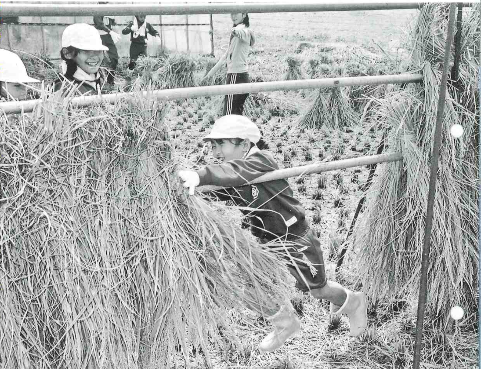
加茂西小学校 みのり田で稲刈りとはざがけ (9月18日)