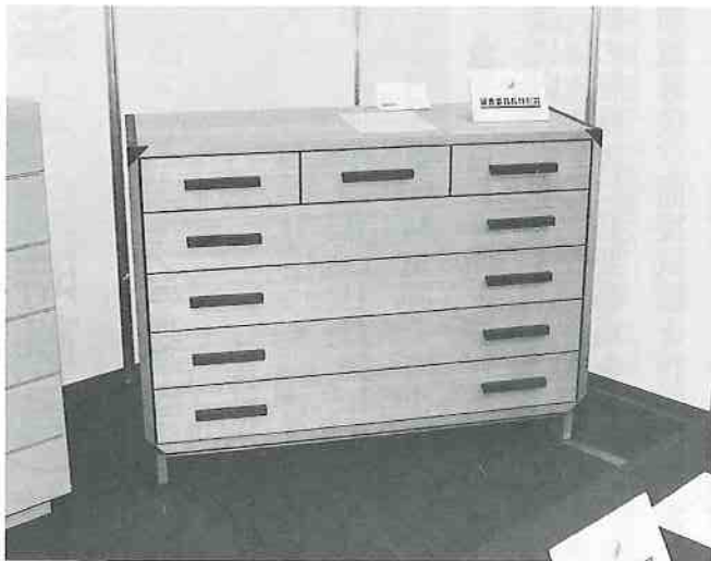
審査委員長特別賞 「ザ・チェスト2007」加茂桐タンス(株)