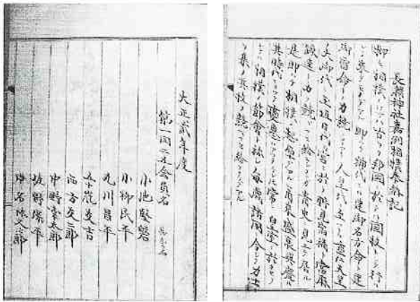
長瀬神社嘉例相撲奉納記にある第1回の会員名

奉納相撲再興の話が起ったのは、大正二年（一九一三）元旦のことである。二十五歳の男子の厄払いに長瀬神社に参詣した氏子の青年たちが直会の宴の席で、奉納相撲の復活を誓ったのが発端となった。この中で、