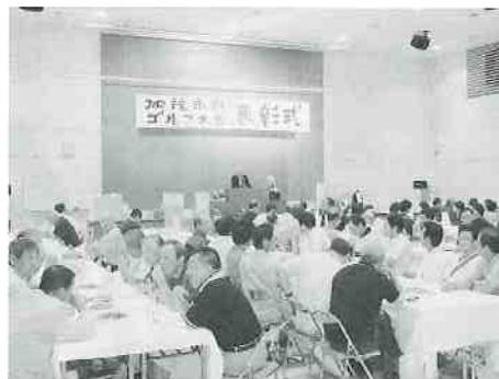
市民ゴルフ大会表彰式（9月2日）