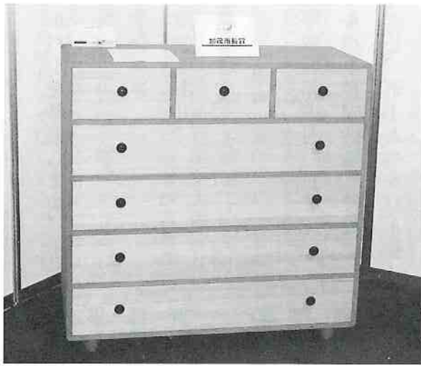
加茂市長賞「grise」(有)桐の蔵