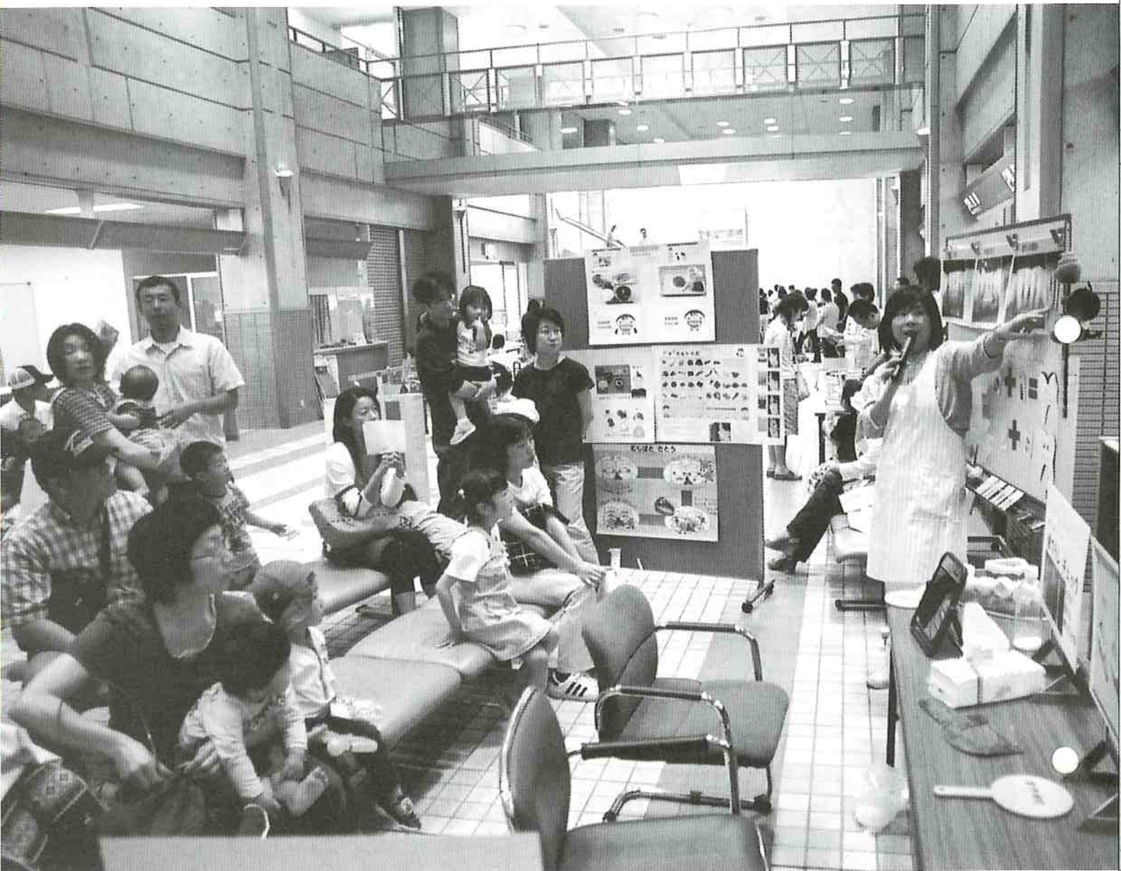
歯っぴいスマイル (6月3日 市役所)