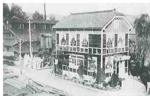
加茂製材事務所棟