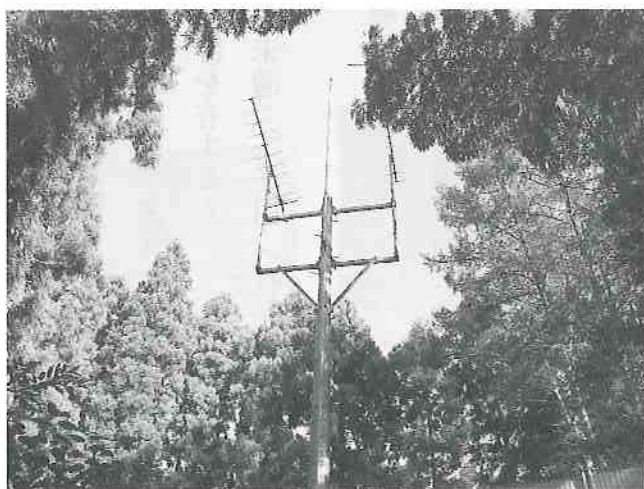
若宮団地内のテレビ共同受信施設

来年度以降も、国の地域情報通信基盤整備推進交付金を使って、市内全ての共同受信施設の改修を早急に進めてまいります。