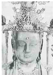
木造釈迦如来坐像