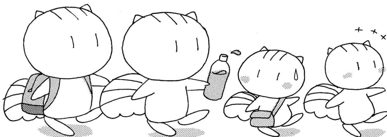
健康づくりのマスコット りすの『こーちゃん』

市民一人ひとりが健康づくりに取り組み 「すこやかで生きがいに満ちた生活」を 送りましょう。