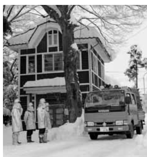
昨年の放水訓練の様子

消防団・消防署では、文化財愛護思想の高揚を図りながら、火災防御体制の万全を期すべく、放水訓練を実施します。伝統と歴史のある文化財を火災から守りましょう。 日時 1月22日(日) 午前8時30分~9時10分 場所 地蔵院(後須田第2) 問い合わせ 加茂地域消防本部 (☎52-1770)