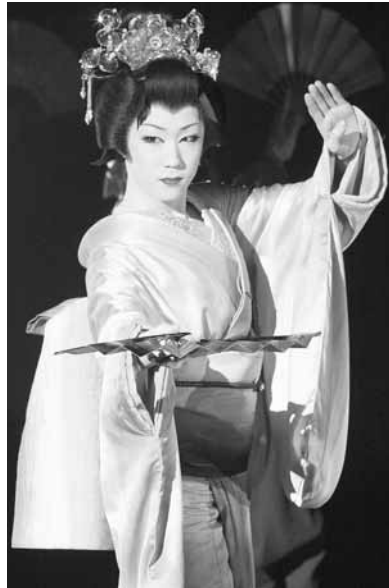
早乙女太一 (さおとめ たいち) プロフィール 1991年9月24日 福岡県生まれ。大衆演劇団「劇団朱雀」の二代目。

2003年に北野武監督作品「座頭市」で映画デビュー。大衆演劇の女形として早くから注目を集め、バラエティ番組やテレビドラマ、映画などに次々出演。今、最も注目を集めている俳優の一人です。