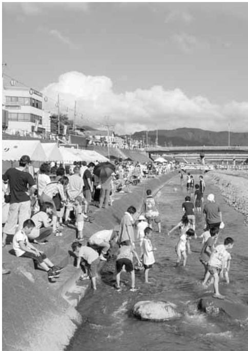
越後加茂川夏祭りて川で遊ぶ子どもたち

下水道整備が完了した地域の皆様には一日も早く接続し、利用されますようお願いいたします。