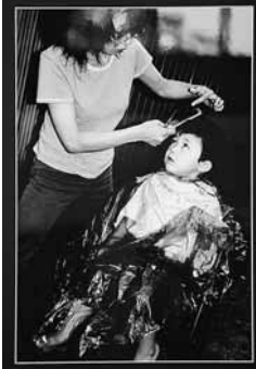
第41回加茂市展 写真の部市展賞作品