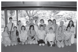
写真は平成27年に訪れた当時 の代表団の皆さん

加茂市が交流を 進めるロシアのコ ムソモリスク・ナ ームーレ市の子供 代表団が7月18日 (火)～25日(火)