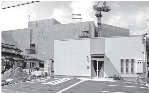
10月22日から業務を開始する加茂・田上病児保育園。奥は建設中の新加茂病院。

しかし、その後、新潟県は加茂病院の前面のところの狭い敷地を提示しただけで協議に応じないまま