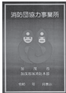
交付される表示証

8割を超えており、加茂市でも事業所の皆様から消防団活動に対する理解と協力を得るため「加茂市消防団協力事業所表示制度」を開始しました。