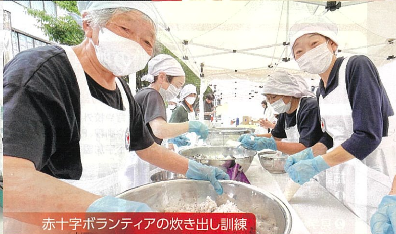
赤十字ボランティアの炊き出し訓練