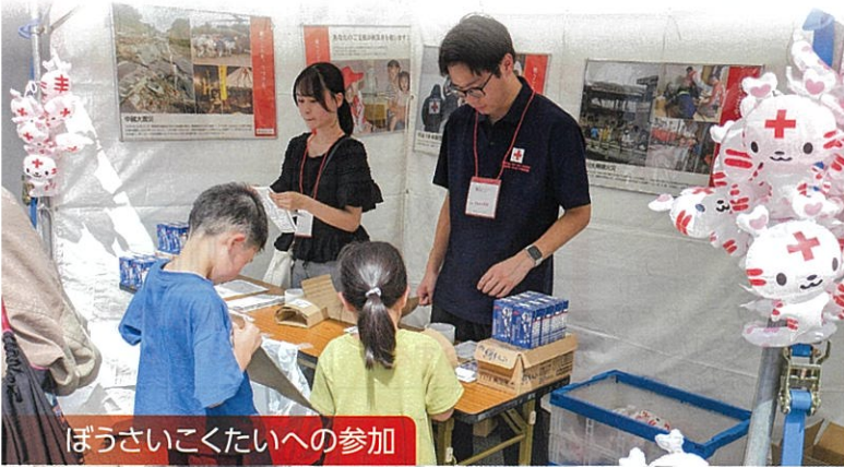
ぼうさいこくたいへの参加