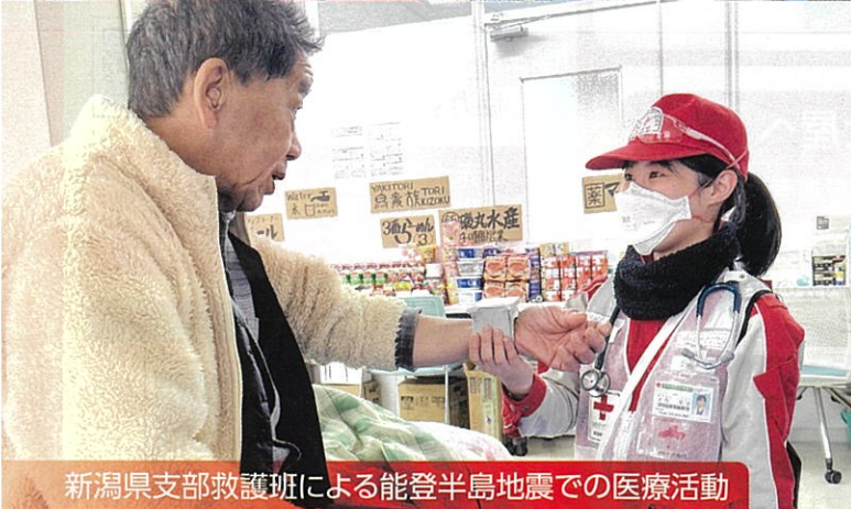
新潟県支部救護班による能登半島地震での医療活動