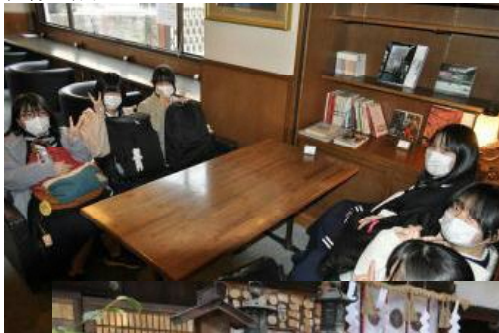
出発前ロビーのひととき…