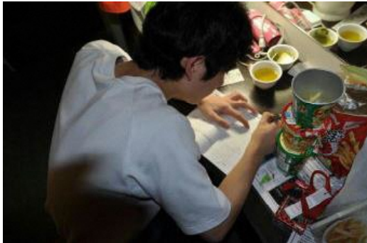
しっかりと一日の記録を取っておかねば…