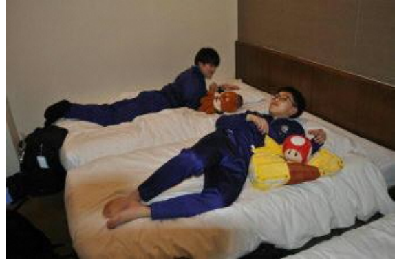
入浴も終えて、「疲れた〜」