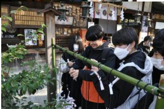
班別研修前に入れたこの神社が大好評!! それぞれの種目の御守りを購入しました。 サッカーが上達しますように… 卓球がうまくなりますように…