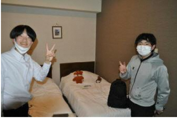
20:50 ようやく部屋に入ったぞ!!