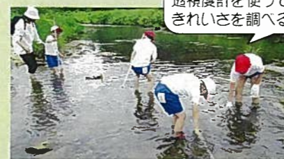
透視度計を使って川のきれいさを調べるよ。

大好きな加茂川について、時間をたっぷりかけて調べ尽くしました。水質調査、支流調べ、上流探検、下流探検、ヤマメ釣り、ウライ漁見学など、多くのことを体験することで、加茂川をますます身近に感じることができました。また、加茂川の自然やよいところをたくさんの人に知ってもらうためのアイデアや、加茂川の環境を守るためにできることを話し合いました。この学習をとおして、子どもたちは加茂川のすばらしさを再発見し、加茂川への愛着をさらに深めました。