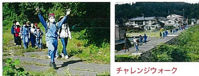
チャレンジウォーク