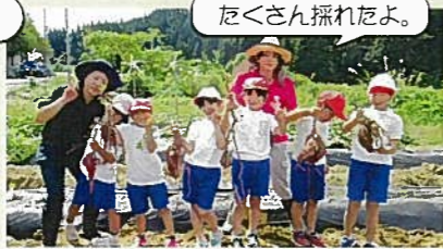
たくさん採れたよ。