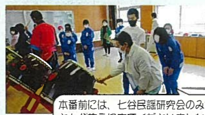
本番前には、七谷民謡研究会のみなさんが教えに来てくださいました。