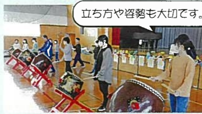
立ち方や姿勢も大切です。