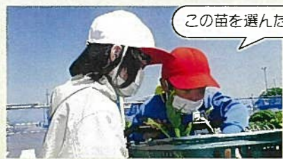
この苗を選んだよ。

畑を耕し、野菜の苗を選んで買い、水やりや草取りをしました。「どうしたらよいのだろう」と考えながら、その度に解決方法を探しました。野菜が病気になった時には、野菜の先生に聞いて、薬をあげてなおしてもらいました。動物に食べられた時には、音を出す機械をつけたり、キラキラテープの柵をしたり、かかしを立てたりして対策しました。収穫ができた時には、野菜の先生を招待して、野菜パーティをしました。人や自然との触れ合いをとおして、観察したり、調べたり、工夫したりする力が伸びました。