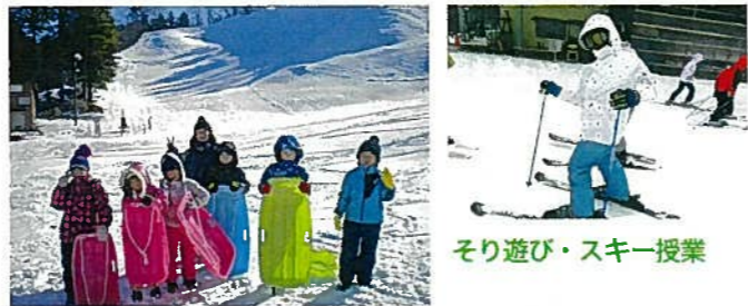
そり遊び・スキー授業