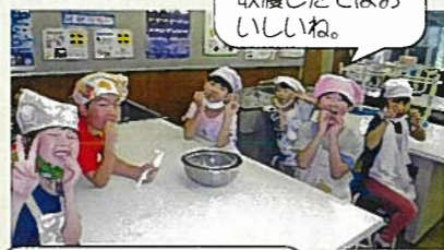
収穫したてはおいしいね。