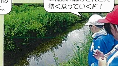
上流は川幅がどんどん狭くなっていくぞ!