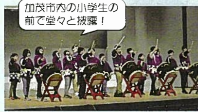
加茂市内の小学生の前で堂々と披露!