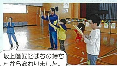
坂上師匠にはちの持ち方から教わりました。

七谷で愛されてきた「七谷甚句」の伝統を受け継ぎ、地域の方に教わりながら練習を重ね、たくさんの人の前で披露しました。伝統を守っていくために、「七谷甚句」のことを多くの人に伝えたいという思いをもち、七谷民謡研究会の方々にインタビューしたり、資料で歴史について調べたりしました。「七谷甚句」の歴史や、歌や踊りがあることなど、分かったことを発表したり、踊り方の講習会を開いたりして、「七谷甚句」のすばらしさを伝えました。学習をとおして、自分たちの思いをどのように実現するかを考え、実践する力が育ちました。