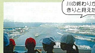
川の終わりがはつきりと見えなよ。