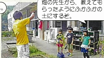
畑の先生から、教えてもらったようにぶかぶかの土にするぞ。