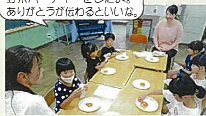
野菜パーティーをしたよ。ありがとうが伝わるといいな。