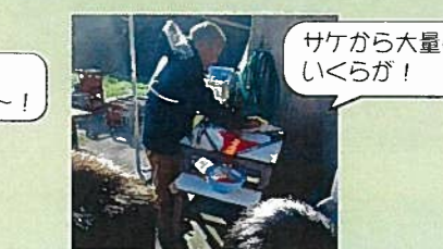
サケから大量のいくらが!