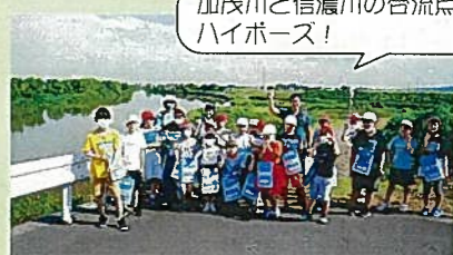
加茂川と信濃川の合流点で、ハイポーズ!