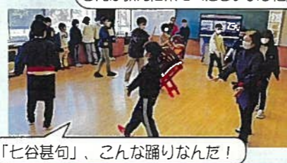
「七谷甚句」、こんな踊りなんだ!