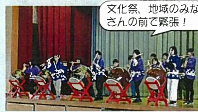
文化祭、地域のみさんの前で緊張!