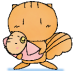
りすのこーちゃん

保健師がお話をうかがいます。 一人ひとりの不安や悩みに合わせた相談や情報提供、必要に応じて関係機関と連携しながら、子育て世代のみなさんを総合的にサポートします。 ひとりで悩まず、まずはお気軽にご相談ください。