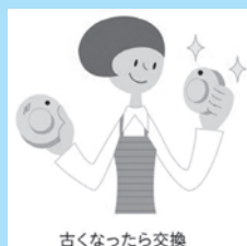
古くなったら交換