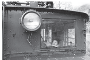
展示の3台とも汽笛が再現されました