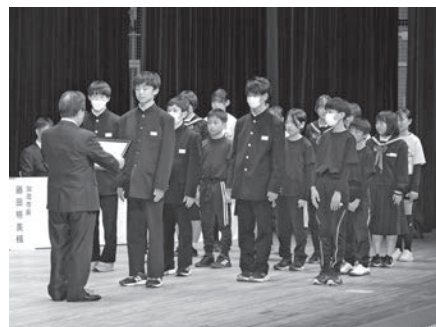
優秀競技者章(団体)の受章の様子