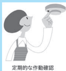
定期的な作動確認