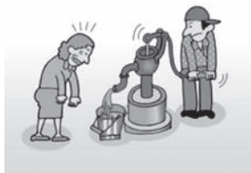
①沢や井戸の水がにごる