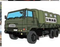
防災関係機関の装備車両等展示