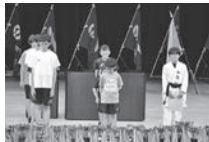
抱負を表明するジュニア選手