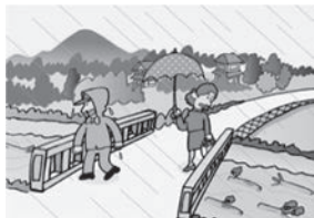
①川の流れがにごり、流木が混ざりはじめる