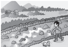
②雨は降り続けているのに川の水位が下がる