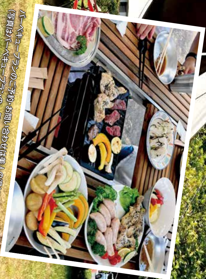
バーベキュープランのご予約・お問い合わせは美人の湯(☎41-4122)へ (写真はバーベキュープランの一例です)