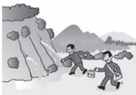
②がけから水が湧き出ている