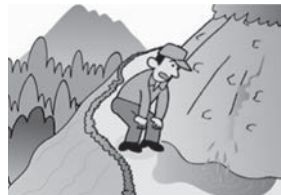
③斜面から水が噴き出す