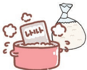
災害用レトルト食品などの湯せんによる炊き出し訓練