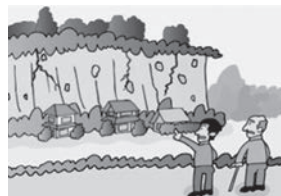
③がけに割れ目が見える