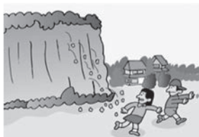
①がけから小石がパラパラと落ちてくる