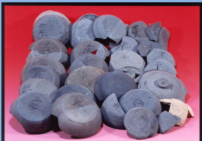
鬼倉遺跡出土墨書土器 平安時代

主な著書：『古代地域社会の考古学』同成社2008年、「地域社会の環境・交通・開発」『環境の日本史2』吉川弘文館2013年、「埋蔵文化財行政の成果と文化財の総合化」『季刊 考古学』第158号 雄山閣2022年ほか多数