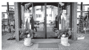
下条分館の玄関前(門松)