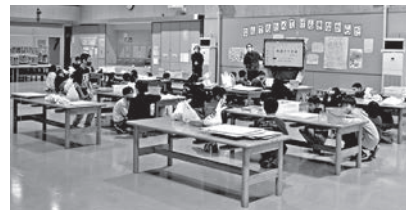
電子黒板を使って手順を確認