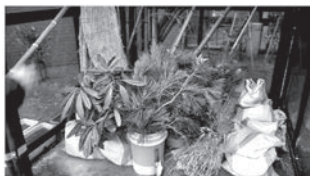
資材のご提供ありがとうございました