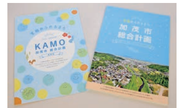
加茂市総合計画と概要版（左）

また、昨年10月に総合計画が策定されたことで、本格的に新しい加茂市を作り上げていく体制ができました。加茂市は「笑顔あふれるまち加茂」を実現するために、健康と教育・文化に力を入れ、小さな自治体でもキラリと光る特色のあるまちを市民の皆さまと一緒に作ってまいります。