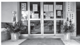
公民館の玄関前(門松)