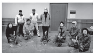
こちらはミニ門松