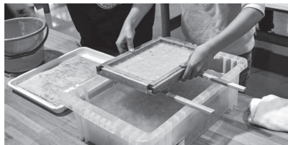
材料(楮)の入った容器から簀桁を上げるところ。ここまでは順調にいくのだが...