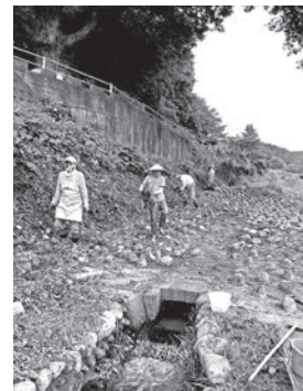
たい積した土砂などの除去は大変だったが、成果が見えると次への意欲に繋がったそうです。