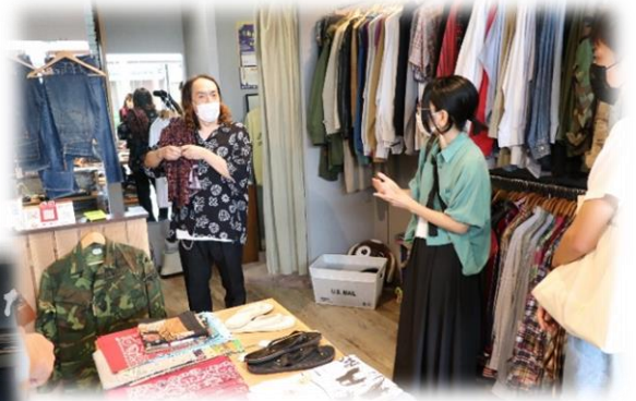
BASE LINEでのインタビュー (穀町)