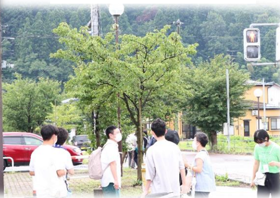
根古屋想い通り (新町)