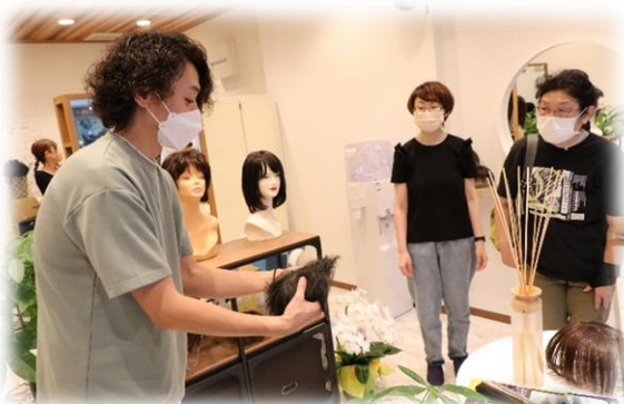
ウヰツケ SO-WA-NIE (穀町) 8月1日 New open!