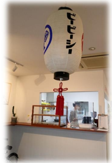
BBC Kamo Miyagemono Center (穀町)