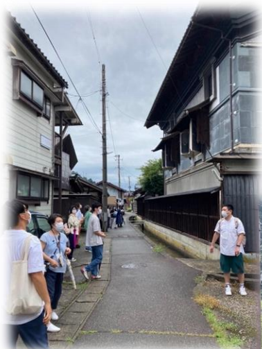
蔵のある谷通り (新町)