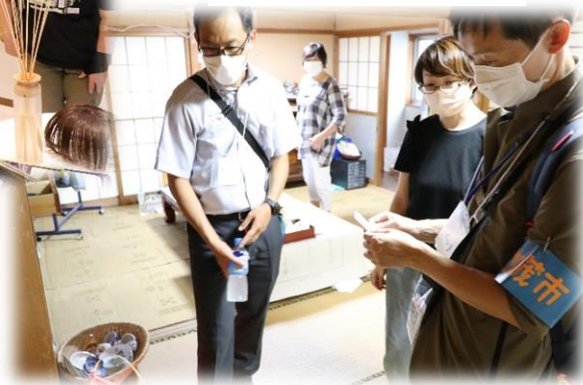
路地裏商店 (穀町) ※期間限定ストア