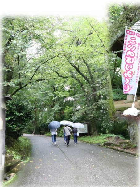
リス園へ向かう道 (加茂山)