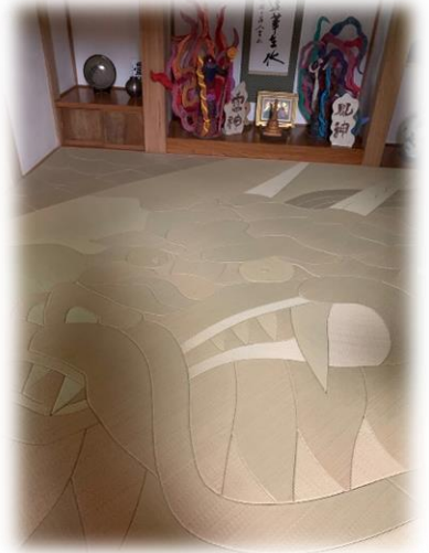
本量寺の龍の畳 (五番町)