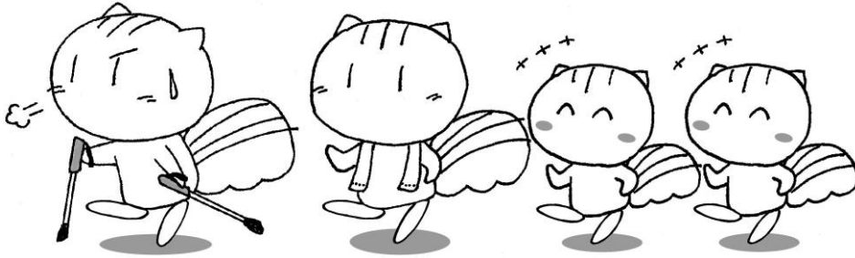
健康づくりのマスコット りすのこーちゃん