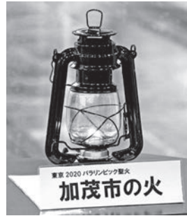
採火当日、美人の湯に展示された「加茂市の火」

加茂市での採火式は加茂七谷温泉美人の湯の中庭で執り行われました。大会ビジョンである「多様性と調和」から、採火には