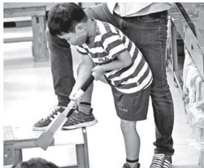
子どもの作業は大人が補助する形で行いました