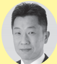
議長 滝沢 茂秋