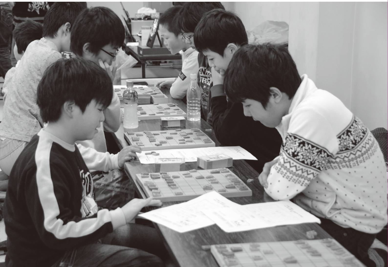
新春市民将棋大会 (1月19日)